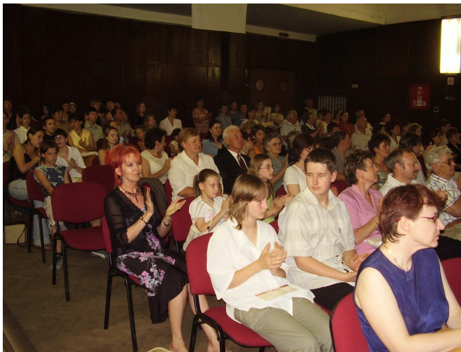
Zaplnená sála kultúrneho domu víta košických filharmonikov