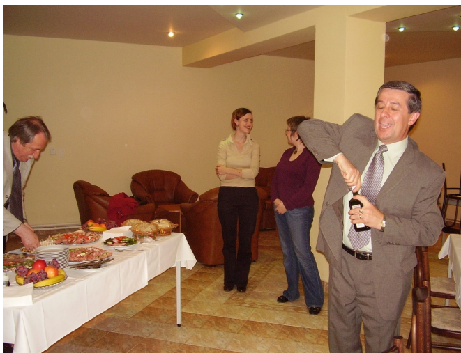
...do toho, pán starosta!