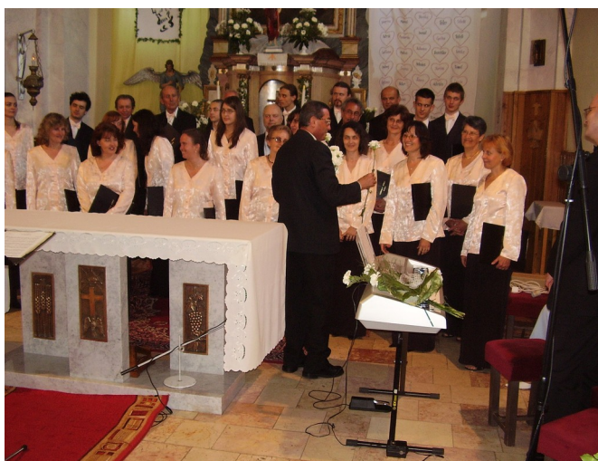
Pán farár sa prihovára k členom zboru