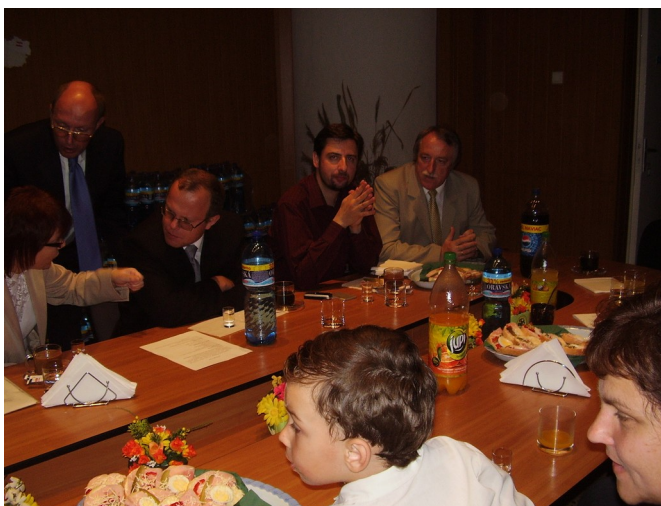
Obecný úrad v Drahňove sa postaral o príjemné pohostenie