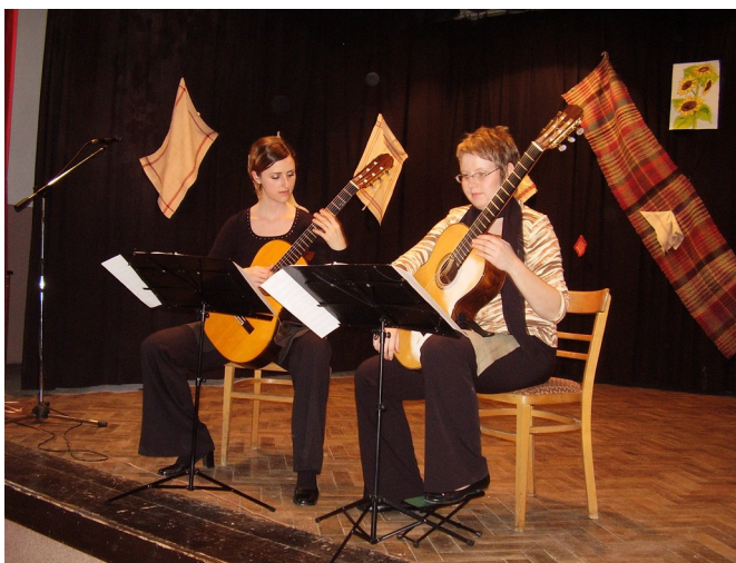
Subtílne hudba gitár sa pre najrôznejšie rušivé zvuky v sále občas strácala