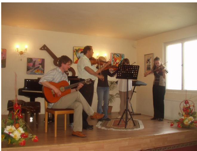
Huslový súbor s veľkým úspechom zahral známy čardáš a mol