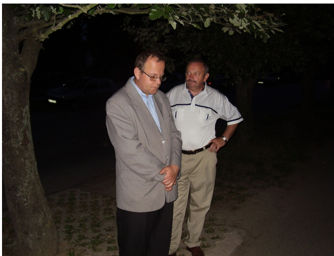
Čakanie na „Godota...“