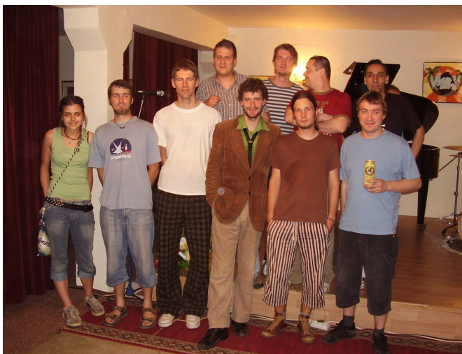
Muzikanti a ich fanúšikovia