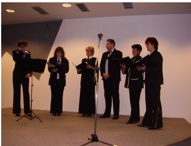
Komorný zbor reformovanej cirkvi, Veľké Kapušany