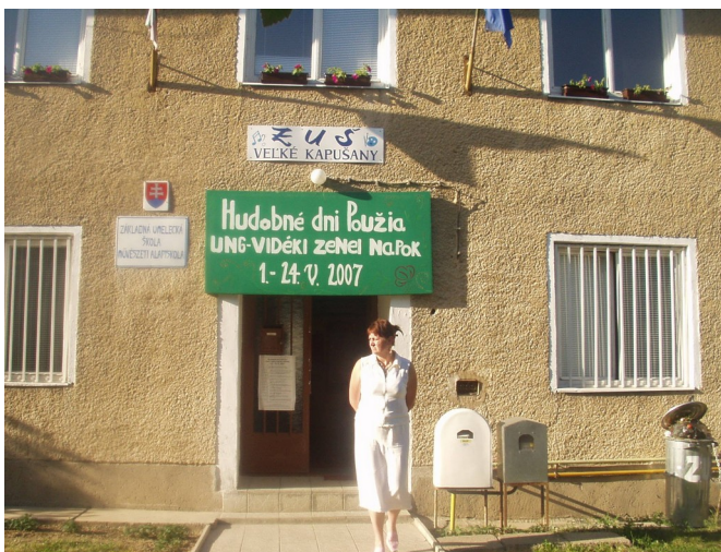
Tešíme sa na ďalší ročník, o rok!