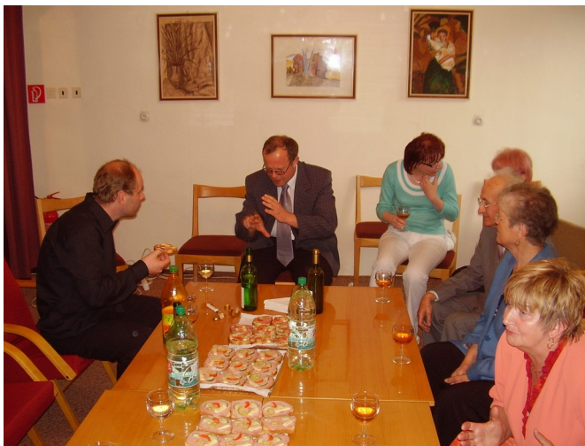
Neodmysliteľná „pokonzertná“ debata s umelcom v Kruhu priateľov hudby