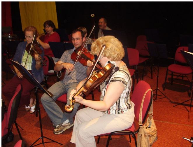
Filharmonici sa rozohrávajú