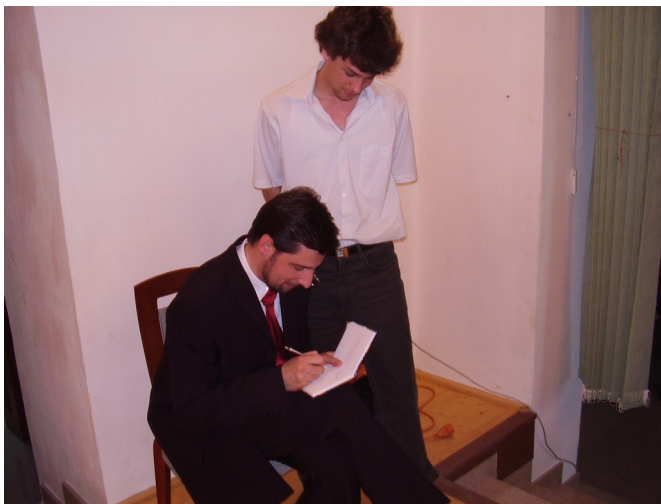
Tento autogram určite stojí za to...