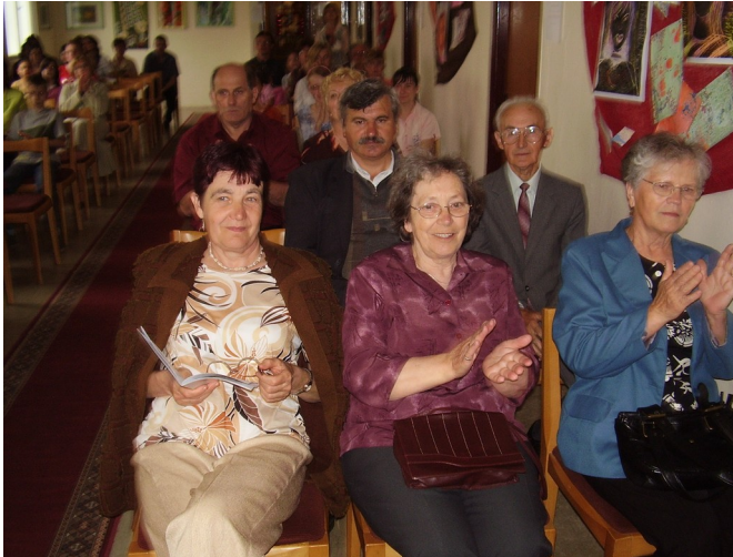
Potlesk pre nášho popredného pianistu