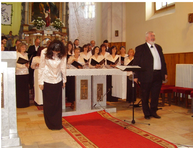
Sladké vychutnávanie aplauzu