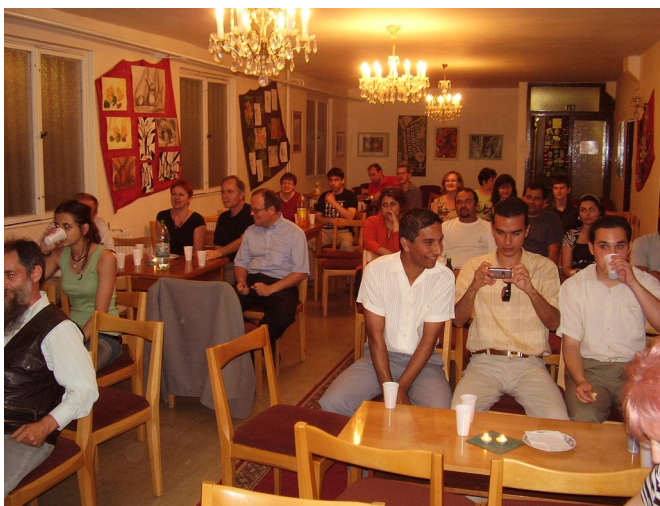
Kto zostal, neof'utoval! Publikum sa zabávalo znamenite