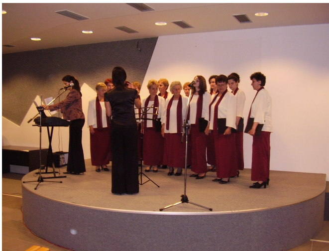
Ženský spevácky zbor Cserfaág, Čierna