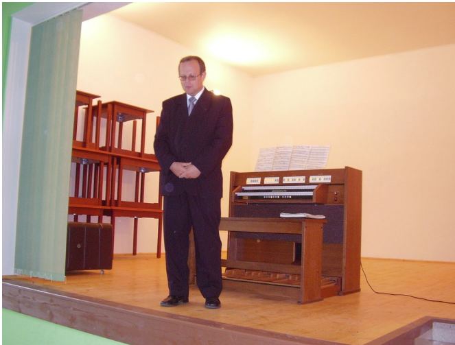
Umelecký riaditeľ festivalu sa na chvíľu stal aj registrátorom