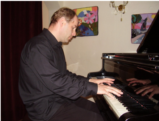
Na programe nechýbala ani skladba od súčasného slovenského autora, nedávno zosnulého I.Zeljenku