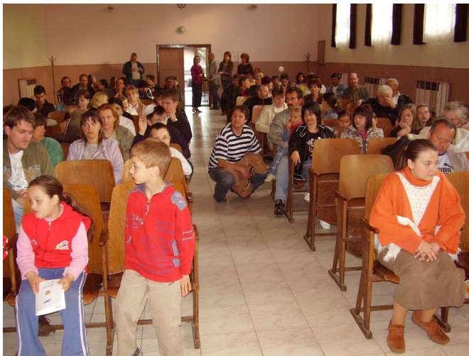
Návštevníci koncertu v zaujatí