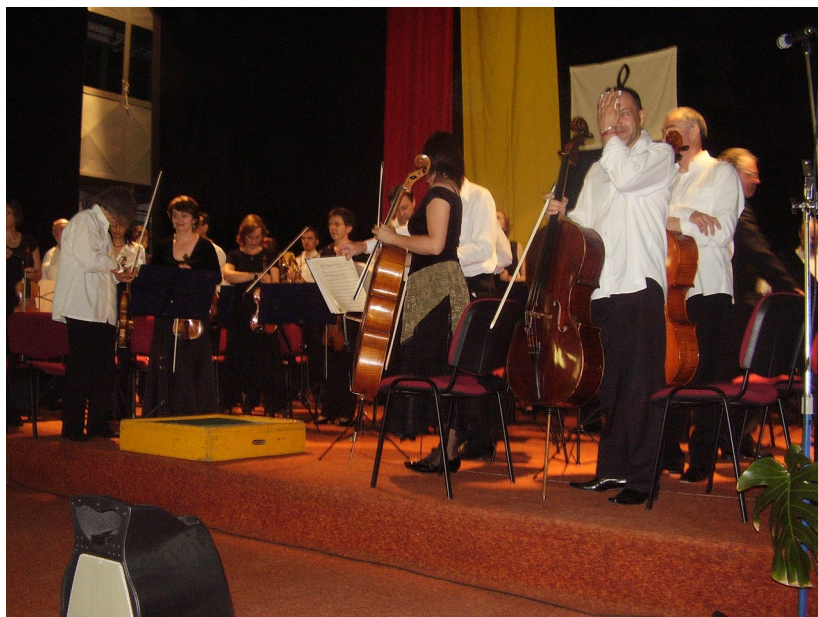
...to bola fuška, ľudia!