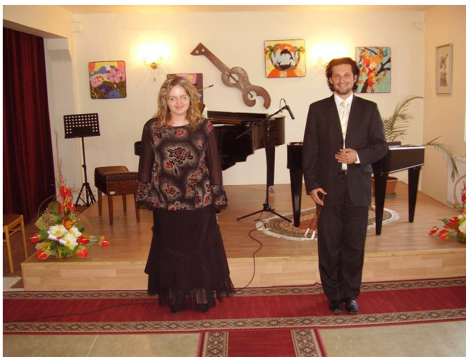
Ani tento koncert sa neskončil bez prídavku...