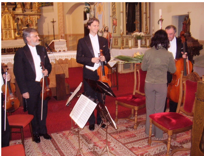
Zaslúžené blahoželanie pre umelcov