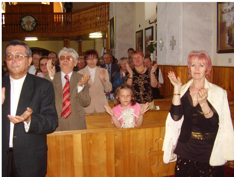
„Standing ovations“, ako sa patrí