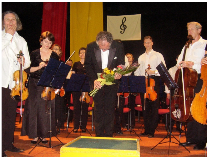
Poklona po Beethovenovej Osudovej