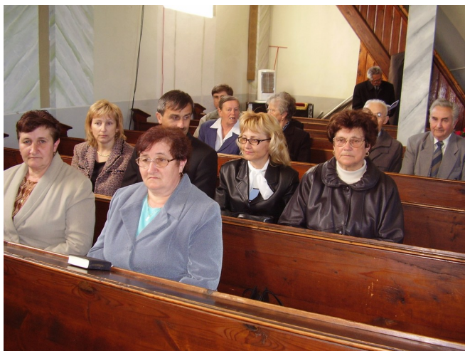
Na koncert si našiel cestu aj nejuden jednoduchý veriaci