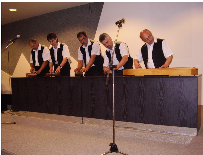
Prehliadku oživilo vystúpenie citarového orchestra Fabotó