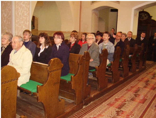
Na koncert prišli aj početní záujemcovia z Veľkých Kapušian