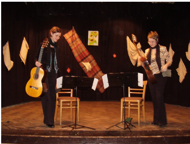
Dvojica mladých žien v absolútnom súlade