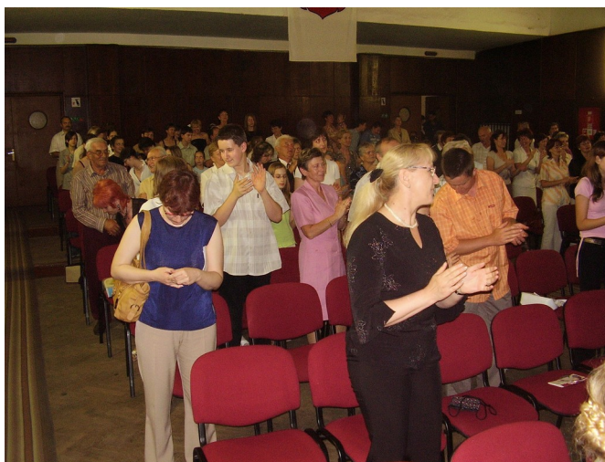
Standing ovations aj na záver festivalu