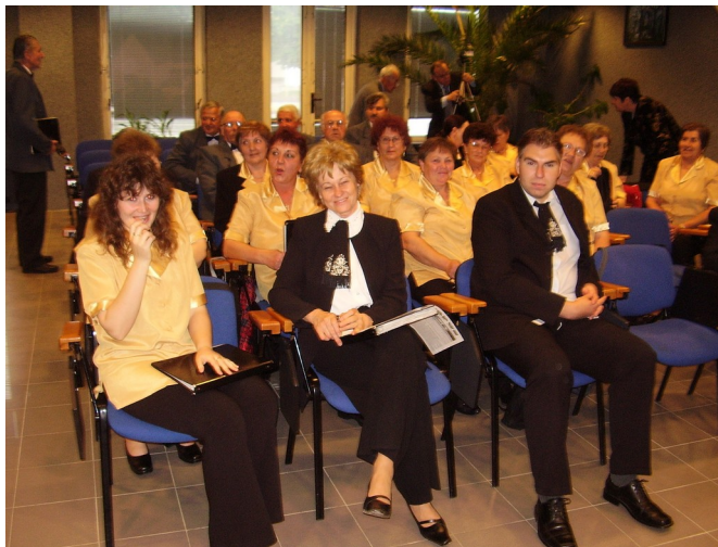
Spevácky zbor Jánoša Erdélyiho, Veľké Kapušany