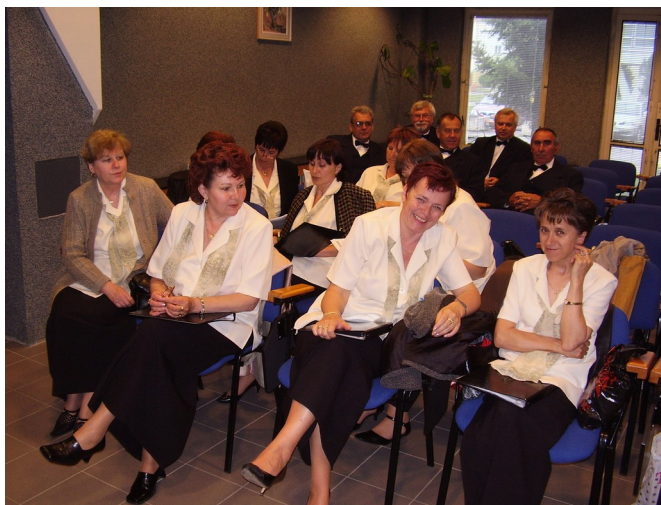
Spevácky zbor Latoričan, Veľké Kapušany