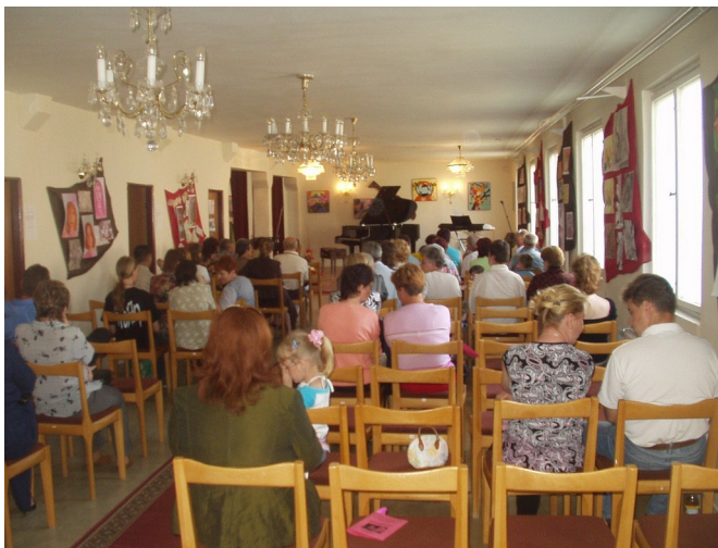
Rodičia a verejnosť pred koncertom

17.5.2007 ZUŠ Veľké Kapušany Tomáš Nemeč