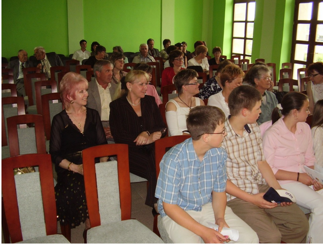
Dôstojné priestory jediného zachovalého kaštiela v okolí