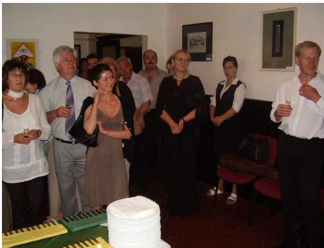
Prípitok a pohostenie vo fotogalérii R.a C. Capa