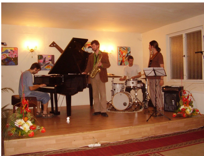
Jazzmani zo žilinského konzervatória si ledva vyložili techniku a už hrali