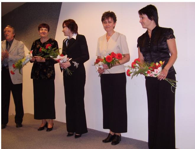
Zbormajstri so zaslúženou kyticou