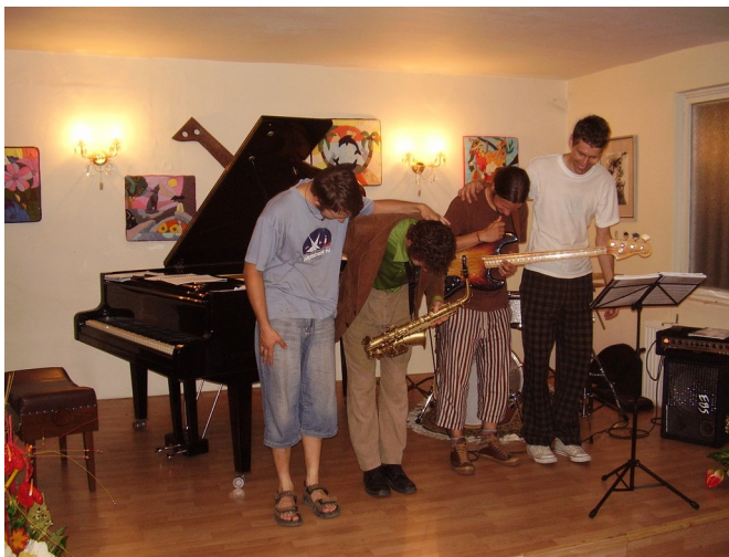
Frenetický úspech v netradičnom prostredí medzi detskými kresbami ZUŠ