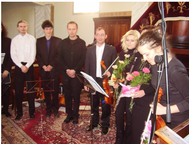
Pri záverečnom aplauze