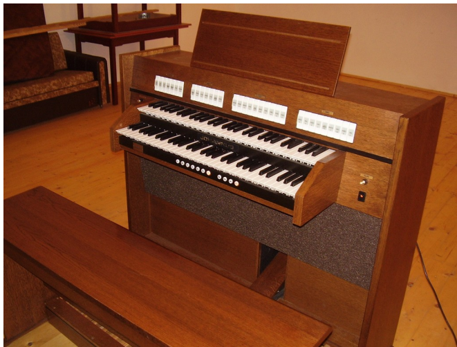
Digitálny organ, na účel koncertu prenájatý zo ZUŠ Sobrance