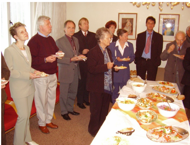
Osobnosti kultúrneho a spoločenského života v meste Veľké Kapušany a Sátoraljaújhely