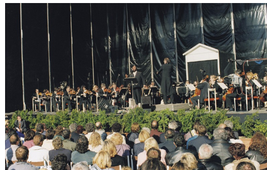
Štátna Filharmonia Košice