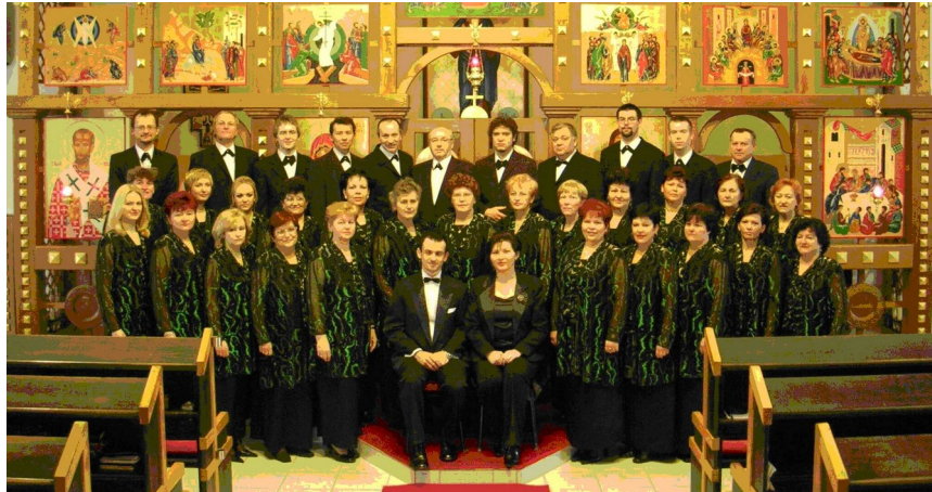
Spevácky zbor CHRYSSOSTOMOS

10. 6. 2006 o 19.00 hod. Lónyaiho kaštieľ Drahňov